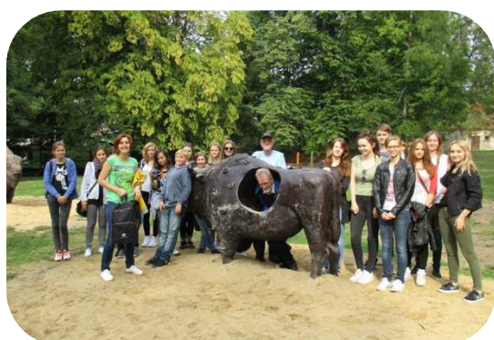
PROJEKT WYMIANY MŁODZIEŻY