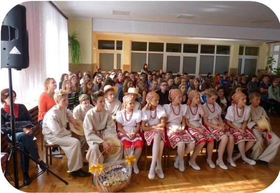
WYSTĘPY GOŚCI Z BIAŁORUSI