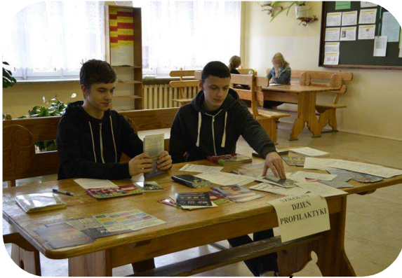
SZKOLNY DZIEŃ PROFILAKTYKI