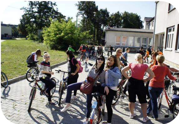
INEGRACYJNY RAJD ROWEROWY