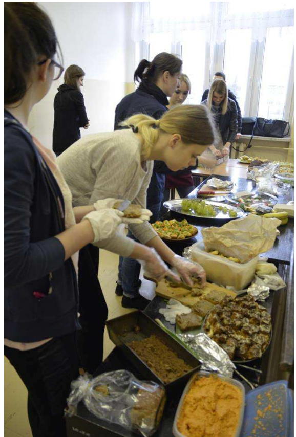
ŻYJ SMACZNIE I ZDROWO