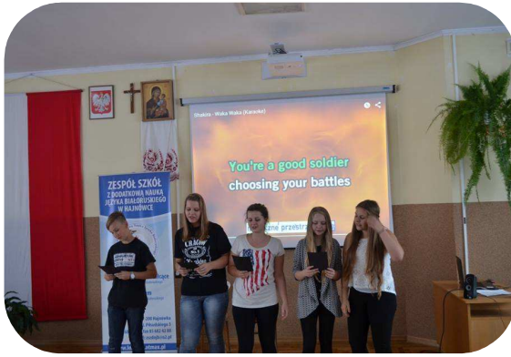
EUROPEJSKI DZIEŃ JĘZYKÓW OBCYCH