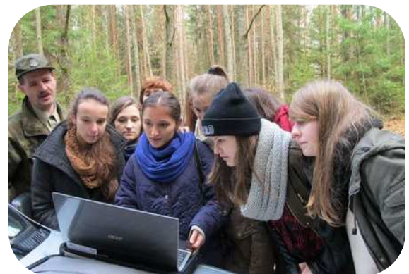
PROJEKT E- PRZYRODNIK