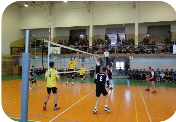
LICEALIADA W SIATKÓWCE