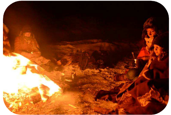
NA PLANIE FILMOWYM