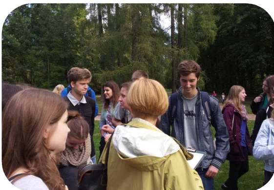
ZAJĘCIA Z BIOLOGII