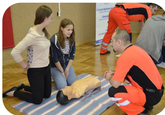
NAUKA UDZIELANIA PIERWSZEJ POMOCY