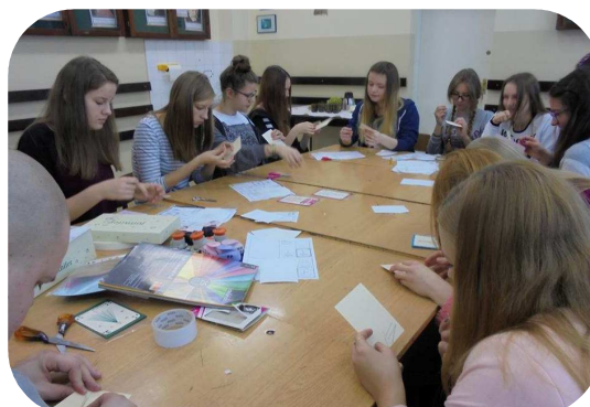
SZKOLNY KLUB WOLONTARIUSZA