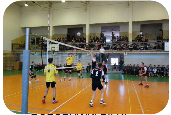
ROZGRYWKI PIŁKI SIATKOWEJ