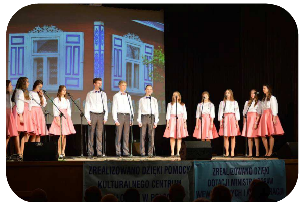
PIOSENKA BIAŁORUSKA 2016