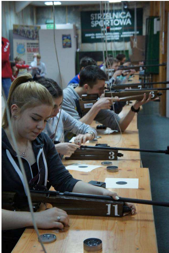
MIĘDZYSZKOLNE ZAWODY STRZELECKIE