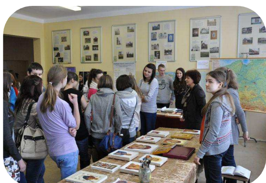
PREZENTACJA KÓŁKA IKONOGRAFICZNEGO