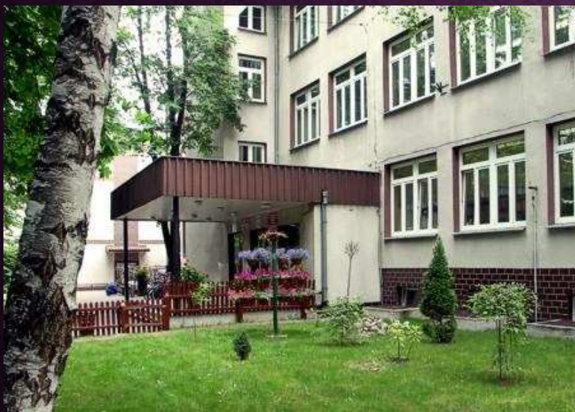
Zespół Szkół z Dodatkową Nauką Języka Białoruskiego w Hajnówce