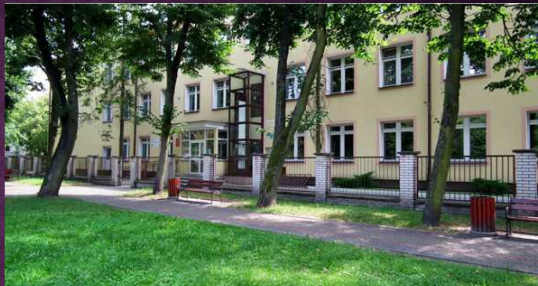
II Liceum Ogólnokształcące z Białoruskim Językiem Nauczania im. B. Taraszkiewicza w Bielsku Podlaskim